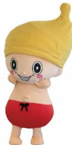
②着ぐるみ画像_ポーズ