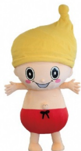
①着ぐるみ画像_正面