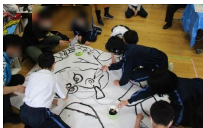
武者絵の輪郭描き