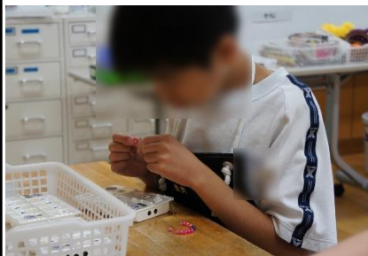
校内実習 ストラップ作り