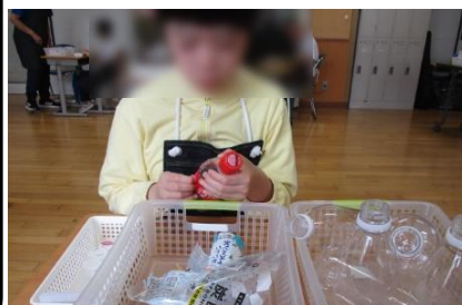
校内実習 エコ活動