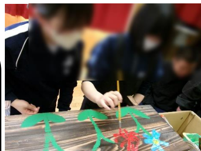
南中生徒とプランターに絵付け

また、6月14日(水)から16日(金)の3日間、前期校内実習を行いました。出来上がった商品は7月7日(金)にネーブルみつけで販売します。生徒たちの活動をぜひ、見にいらしてください。