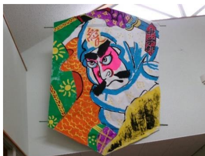
出来上がった大風を校内に展示

中学部の今年のテーマは「仲間とともに地域とつながろう～地域の人・もの・こと～」です。