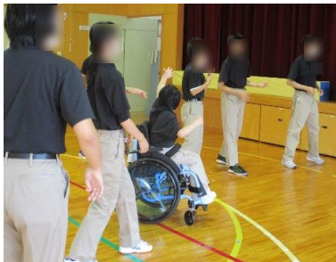
昼休みのダンス練習、頑張っています。