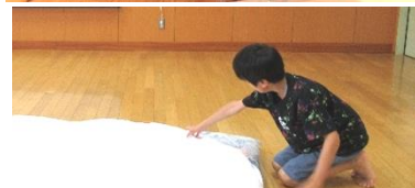
校内宿泊に向けて布団敷きの練習

6月29日(木)・30日(金)、6年生が修学旅行に行ってきました。テーマは「みんなで仲良く、楽しく、おいしく」。挨拶やお礼の言葉、買い物(家族への土産)もばっちり。解散式での満面の笑みからは、やり切った自信が伝わってきました。