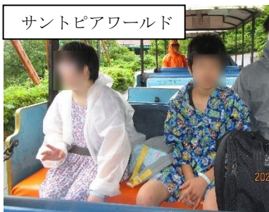
サントピアワールド