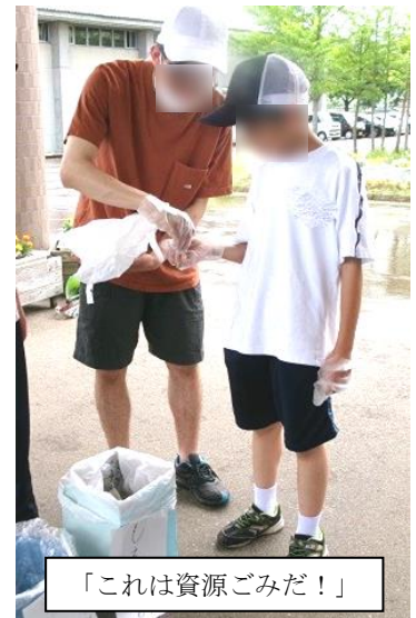
「これは資源ごみだ！」