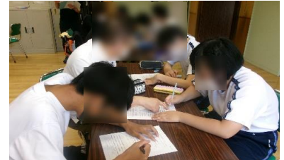
曲の歌詞について分析中…

前期実習後から、ダンスリーダーを中心に、昼休みの時間を利用して積極的にダンス練習を行う愛好会メンバー、また音楽の時間には歌唱活動に一生懸命取り組んでいます。2学期本番の発表を是非楽しみにしてください。