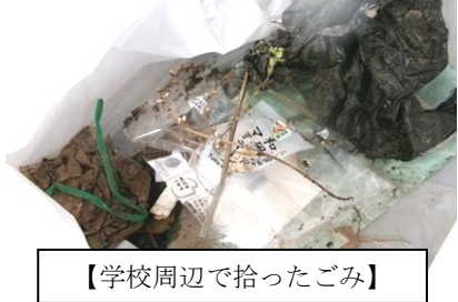
【学校周辺で拾ったごみ】

6月下旬の総合的な学習の時間に、「地域をきれいにしよう」の学習を行いました。事前学習ではクイズ形式でごみの分別を学習し、後日、学校周辺のごみ拾いに出かけました。