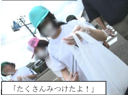
「たくさんみつけたよ！」