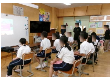
きらっと集会で、スローガンや曲目を確認しました。

高等部では2学期に行われる「きらっと on ステージ」に向けての練習がスタートしています。