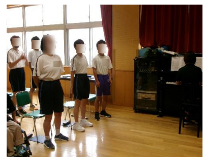
リズムと音程、覚えるぞ！