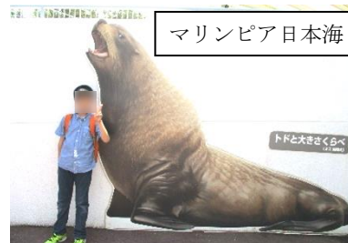
マリニピア日本海

7月13日(木)・14日(金)は、4・5年生の宿泊学習(in学校)。自分のめあてを具体的に決め、布団敷きや入浴、バス乗車や買い物、ボウリングの練習をしました。当日は、自分の役割を果たし、「できた」「楽しい」と思える体験となりました。